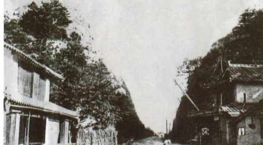
Inohana Pass circa 1948

Jinnojo advocated the plan of transporting water from the Yoshino River to Sanuki through a tunnel in the Asan Mountains (the present-day Kagawa Canal) and building a bridge connecting the islands of Honshu and Shikoku (the present-day Seto Ohashi Bridge), which tells us the greatness of his foresight and idea.