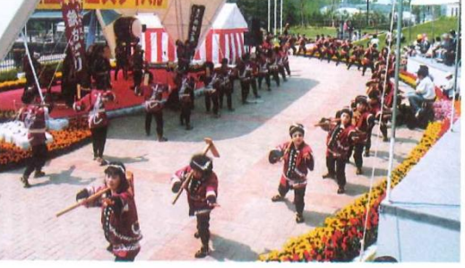
Kuwa Odori (Hoe Dance) to praise Jinnojo's achievement

This map is reproduced from Digital Map 25000 (map image) published by the Geospatial Information Authority of Japan (GSI), with the permission of the head of GSI. (Permission No.: Hei 20 Shi Fuku No. 92)