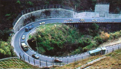
Present National Highway Route 32