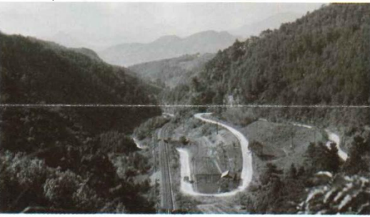
The former National Highway Route 32 before improvement (Near the JR Inohana Tunnel)